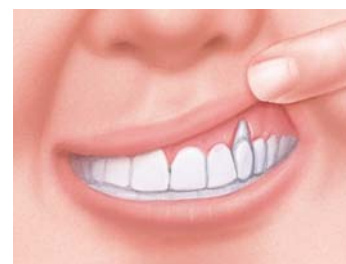
La retrazione del margine gengivale lascia scoperta la dentina e provoca sensibilità