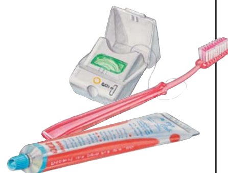
Per scegliere il dentifricio più adatto è meglio farsi consigliare dal dentista